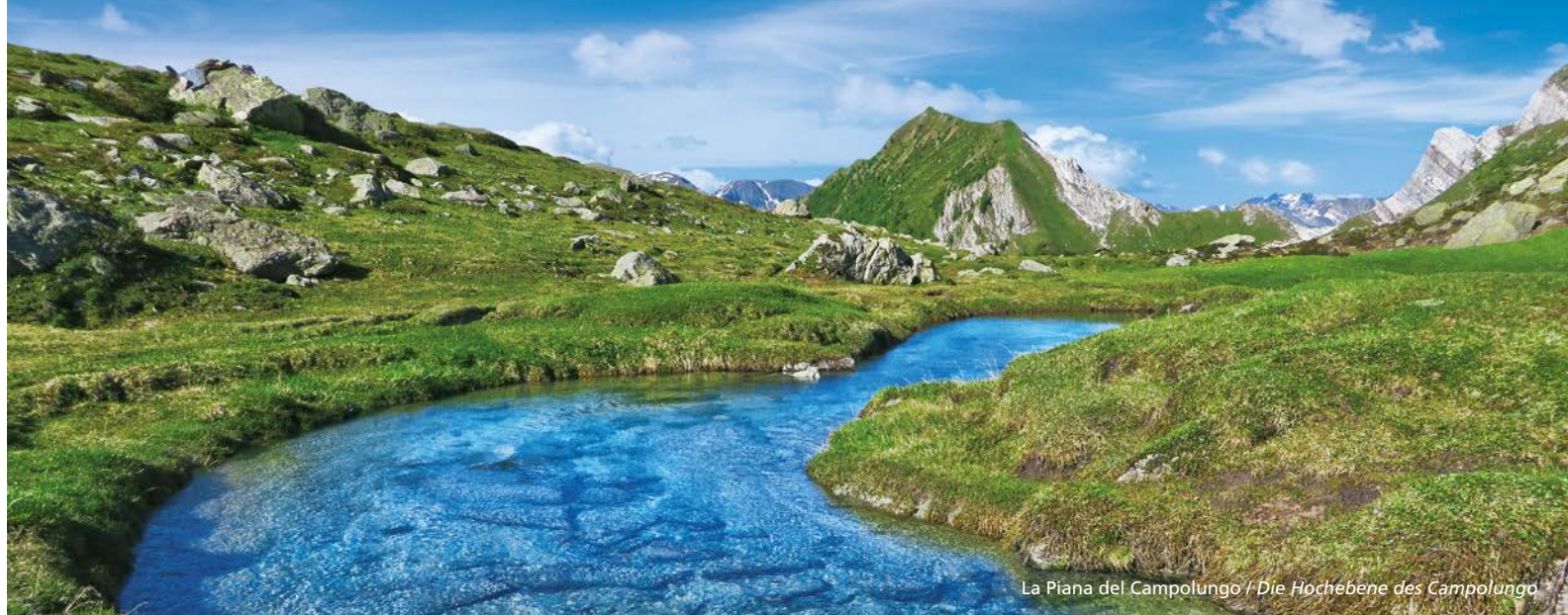
La Piana del Campolungo / Die Hochebene des Campolungo

Capanna Campo Tencia +41 (0)91 867 15 44 info@campotencia.ch www.campotencia.ch