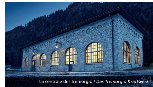
La centrale del Tremorgio / Das Tremorgio Kraftwerk

Il Lago Tremorgio è anche una preziosa testimonianza della storia della produzione idroelettrica del nostro Cantone. La centrale ai piedi della teleferica è infatti una delle più vecchie tuttora in funzione in Leventina. Le tavole de La via dell'energia di AET, poste alle stazioni di arrivo e di partenza della teleferica, raccontano questa storia.