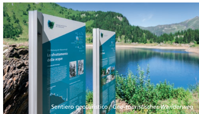
Sentiero geoturistico / Geo-touristischer Wanderweg