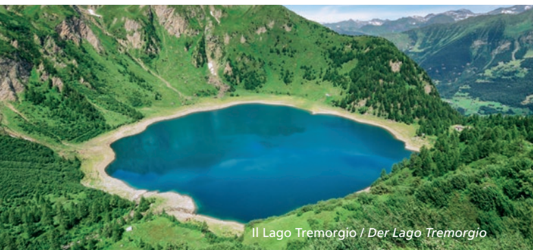
Il Lago Tremorgio / Der Lago Tremorgio

Supplemento trasporto di colli e/o materiali ingombranti (che occupano un posto): CHF 5. Gruppi/scuole: condizioni speciali su richiesta (contattare in orario d'ufficio). Zuschlag für voluminöses Gepäck/Rucksäcke: CHF 5. Gruppi/Schulklassen auf Anfrage (Informationen während den Bürozeiten).