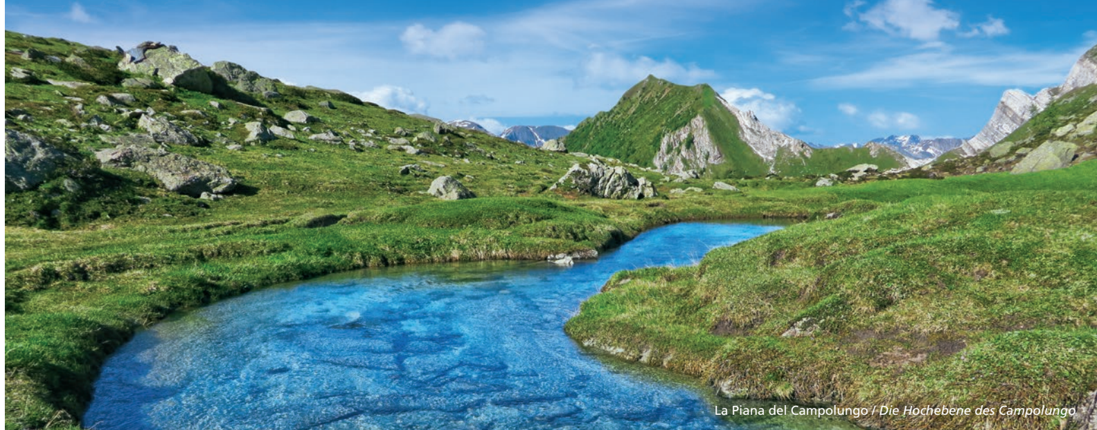
La Piana del Campolungo / Die Hochebene des Campolungo

Capanna Campo Tencia +41 (0)91 867 15 44 info@campotencia.ch www.campotencia.ch